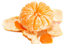
۲ عدد نارنگی