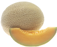
۳۰۰ گرم طالبی