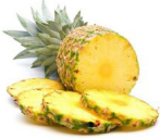
یک برش متوسط آناناس