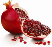
یک عدد انار