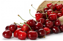
۱۲ عدد گیلاس