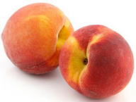
یک عدد شلیل یا هلو