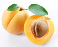
۳ عدد زردآلو