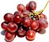
هفده حبه انگور