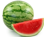
۴۰۰ گرم هندوانه