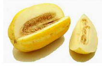
۳۰۰ گرم خربزه